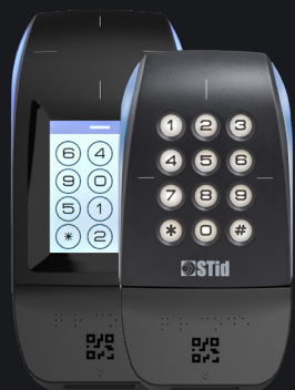
Disponible en versions clavier et écran tactile