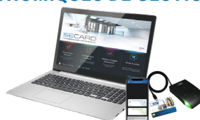
SECARD Kit de programmation SECard et les protocoles SSCP® v1 & v2 et OSDP™

* Nos lecteurs lisent uniquement le numéro de série / UID PICO1444-3B de la puce iCLASS™. Ils ne lisent ni les protections cryptographiques iCLASS™ ni le numéro de série / UID PICO 15693 de HID Global.